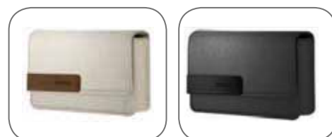
pouzdro, kombinace plátna a kůže