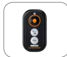
voděodolné dálkové ovládání RC1